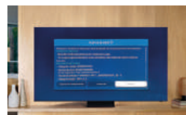
Foto del TV en el entorno