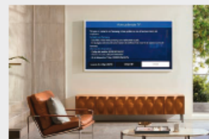
Foto del TV en el entorno

Si has comprado un The Frame , recibirás un link para efectuar tu registro para conseguir también el marco de regalo. 1